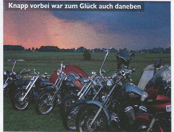
Knapp vorbei war zum Glück auch daneben