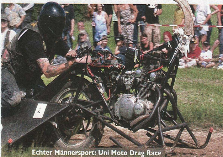
Echter Männersport: Uni Moto Drag Race