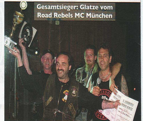
Gesamtsieger: Glatze vom Road Rebels MC München