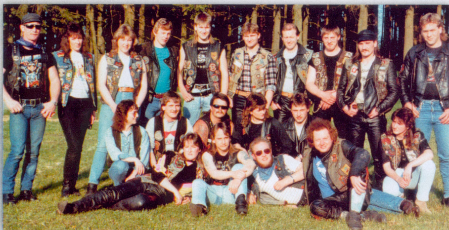
Die Chaindogs in den 80er Jahren

Asphalt Cowboys MC, Alemannia MC, MRST Altomünster, Bastards MC Gaildorf, Bloody Souls MC, Brothers of Blood MF, FMC Centaur, EX Pfaffenhofen, Easy Livin MC Immenstadt, MF Evil Seet, Firedragons MC, Four Roses MC, Gypsies MC, Golden Drakes MC FFB, Good old Boys MC, MF Grossenhag, Hawks of Highway MC, MF Hawks, Hell Driver MC Nomads, Iron Horses MC Munich, MF Legion Maisach, Lone Star MC, Macabros Crew MC, Motors MC, Neufnachtal MC, Nomaden MC, OMC Mering, PCK MC, MF Planlos, Racing Death MC, Remaining Alliance MC Dachau, Road Eagle MC Munich / Kempten / Altötting / Arnsdorf, Road Rebels MC, Rolling Wheels MC, MF Sylver Ladys, Skorpions MC Allgäu, Sons of the Night MC, Speedys MC Belgium, Suseck MC, Star Riders Germany, Thunderbirds MC Schrobhausen, Tramps MC Allgäu, Trappers MC Allgäu, Warlocks MC Allgäu, Wildscatter MC, Wheels of Steel MC Bavaria, Wheels of Steel MC Schwaben, Wolfmen MC Donauwörth / Eichstätt / Kaufbeuren / Neuburg / Oberfranken / South / Sontheim, MF Wüdsau