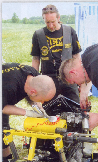
Chirurgische Eingriffe vor dem Start