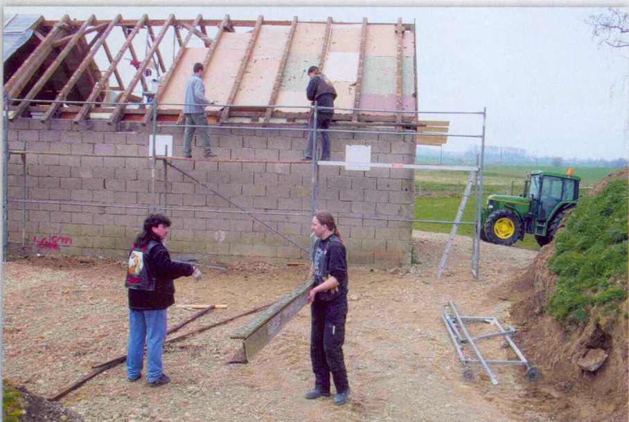
Die Brothers bauen ein Clubhaus

Altstetten I 85253 Erdweg Tel 0162 - 379 40 70 Das Clubhaus ist jeden zweiten Freitag geöffnet www.mc-chaindogs.de