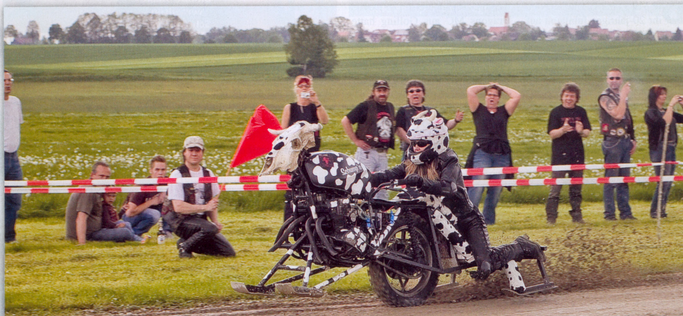
Die „Fliegende Kuh“ vom Schumpn Team Allgäu wurde von einem Mädli gebändigt

Zum eigenen Jubiläum richtete der Chaindogs MC die vierte Bayerische Unimoto Drag Race-Meisterschaft aus