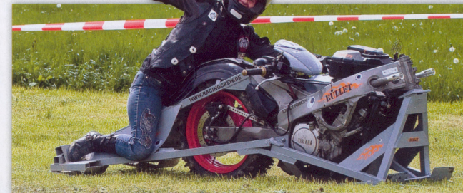
Frau am Steuer mit Ungeheuer: „Na Jungs wie war ich?“

Seit Anfang des Jahres waren alle Member des Clubs damit beschäftigt, die Party zum 30-jährigen Clubbestehen und die vierte Bayerische Unimoto Drag Race-Meisterschaft vorzubereiten. 16 Unimoto-Teams hatten den Weg zum Chaindogs MC gefunden. Ihre Höllenmaschinen waren im vorangegangenen Leben gepflegte Straßenräuber von Honda, Suzuki, Yamaha oder Kawasaki. Inzwischen sind deren Herzen in Eigenbaurahmen verpflanzt worden. Damit muss in kürzester Zeit eine Distanz von 30 Metern zurückgelegt werden. Und das ohne