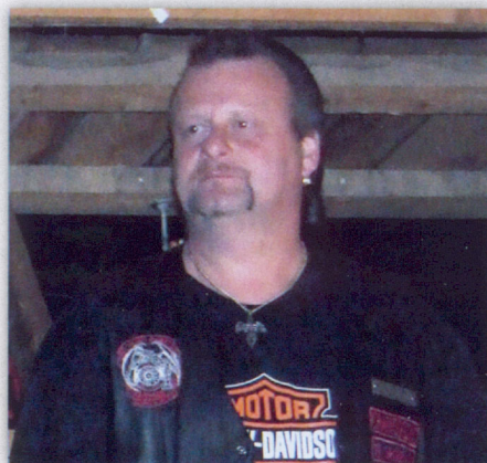
Gone but not forgotten. Bluesman verstarb im Jahr 2008