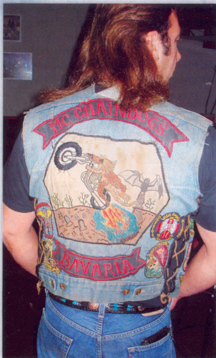
Das alte Colour der Chaindogs

schaubar. Im Laufe des Abends hämmerte die Band „First Coming“ Heavy Metal bis zur Pokalverleihung