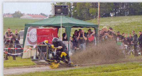
„Drag Race“ kommt nicht von „Dreck Race“